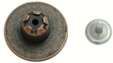
Botón denim - Sistema industrializado - Autoperforante - Mínimo 5000u - Sin previa muestra