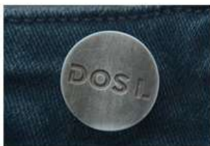
Boton remache - frente