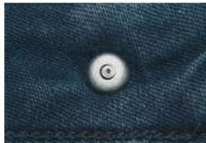
Boton remache - dorso